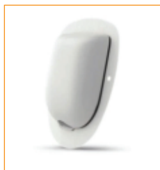
Pompe à insuline