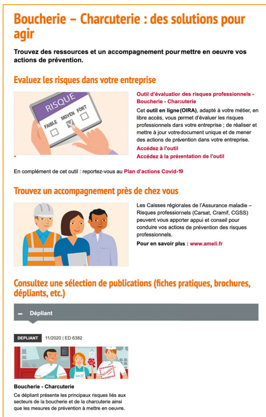
Figure 1 : L'offre en ligne pour les boucheries-charcuteries

en œuvre sur une sélection de risques spécifiques à chaque profession. Des fiches sont ainsi d'ores et déjà disponibles, notamment pour la restauration traditionnelle, le commerce de détail non alimentaire, le transport routier de marchandises et les prothésistes optiques.