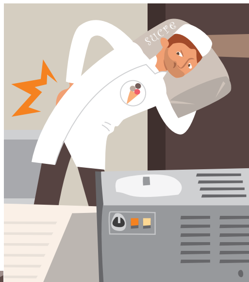
DOULEURS AU DOS