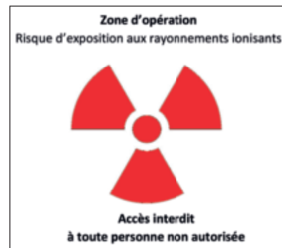
Figure 3 : Signalisation d'une zone d'opération.

et organisationnels retenus par l'employeur est consignée sous une forme susceptible d'en permettre la consultation pendant au moins dix ans.