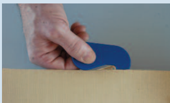
Un outil parfaitement adapté à l'ouverture sans risque du courrier

méthodes de coupe ou à des efforts anormaux liés à l'emploi de lames émoussées,