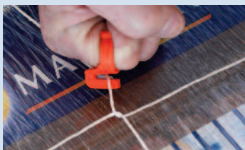
Anneau coupe ficelle