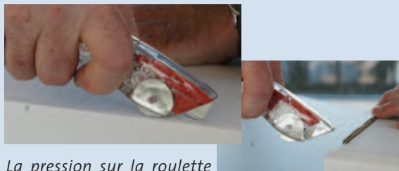
La pression sur la roulette maintient la lame sortie. Dès la rupture de contact, la lame est rappelée dans son logement