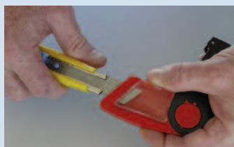
Dans le cas du cutter à lame sécable, ce réceptacle élimine le risque de coupure lors de la manipulation du bout de lame usée... (© M)

...Par la suite, il est vidé dans une boîte de collecte qui permet la gestion sans risques des déchets dangereux (© M)