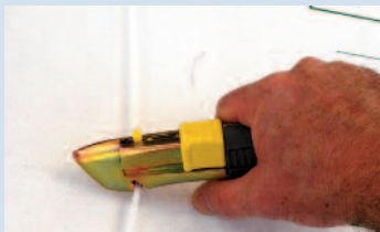
Outil à double usage : il coupe aussi le feuillard plastique. Utilisé lame sortie, la rétractation a lieu en fin de coupe même si le poussoir est maintenu appuyé