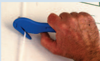
Couteau de type «bec de perroquet» : la forme de l'ouverture sur le tranchant évite toute blessure