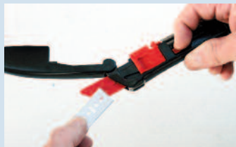
Remplacement de lame facilité, risques diminués (© M)