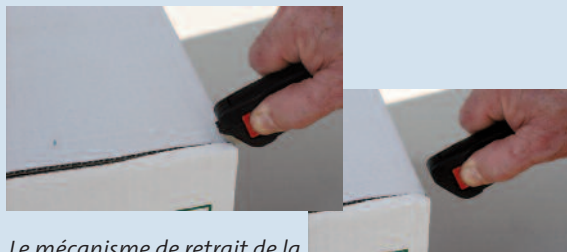
Le mécanisme de retrait de la lame agit alors que le poussoir est maintenu appuyé (© M)

Quel est le lieu le plus approprié pour apposer les affiches de sécurité ?