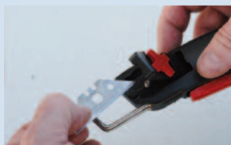
Ce couteau conçu pour l'ouverture des sacs plastiques, papier, etc. est doté d'un étrier autobloquant qui recouvre automatiquement le tranchant de la lame en fin de coupe. Ici retournement de la lame usée.