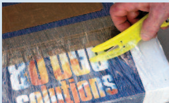
Un coupe film