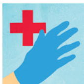
Secteur de soins