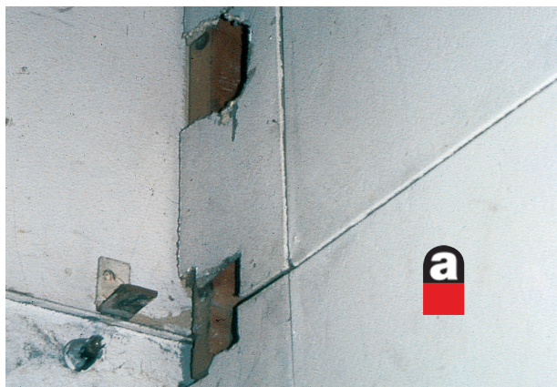
◀ Dans les plaques de plâtre