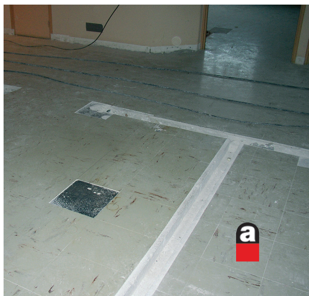
Dans les dalles vinyle-amiante ▶