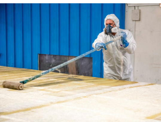
Figure 2. Fabrication de piscine : demi-masque filtrant, combinaison avec capuche et gants composent l'équipement de protection individuelle au poste de stratification.

Ces vêtements subissent également un test de perméation réalisé avec 15 substances listées dans la norme, ainsi qu'un test de résistance à la flamme.