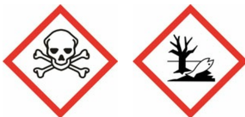
CYANURE DE SODIUM