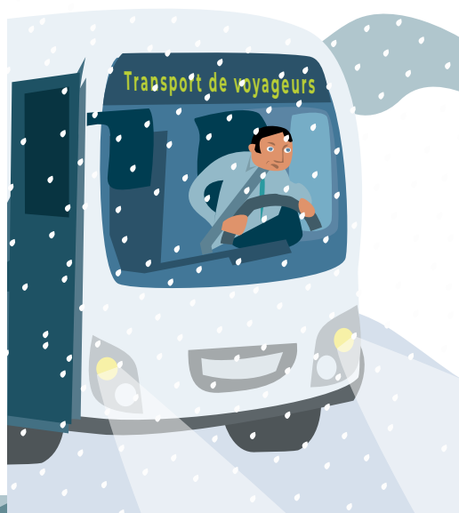
SUR LA ROUTE