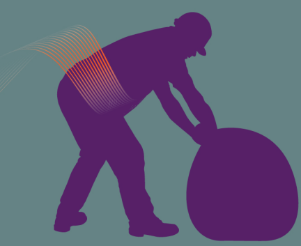
Mal au dos