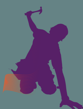
Mal au genou