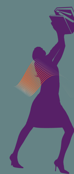
Mal à l'épaule