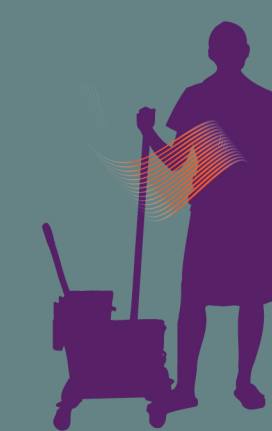
Mal au coude