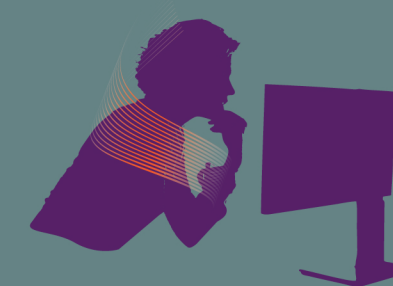
Mal au cou